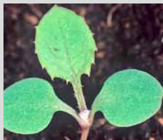
Осот жовтий (сходи)

Карібу® Дуо Актив — це покращена концепція комплексного післясходового захисту цукрових бур'яків для звичайних та особливо проблемних польових ситуацій.